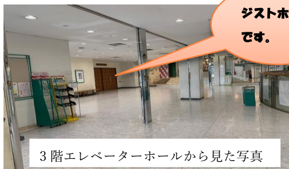
3階エレベーターホールから見た写真

〒640-8433 和歌山県和歌山市中野3-1-1 パームシティ 3F ジストホール